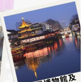
參觀博物館及 欣賞江蘇文化