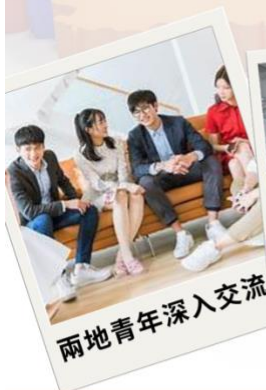
兩地青年深入交流